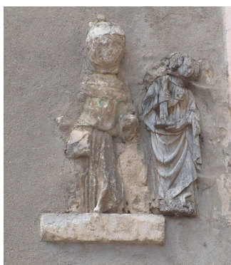
Photo 5 : Deux figurines sculptées dans le mur, 62, Grande Rue Elément paysager n°15